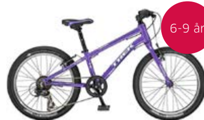
Trek Superfly 20 Messepris: 3.599,-