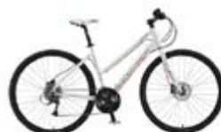
Hardrox C3 Lett og slitesterk hybridsykel med hydraulisk skivebremser. Messepris: 7.290,-