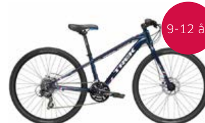
Trek Dual Sport barn Messepris: 4.599,-