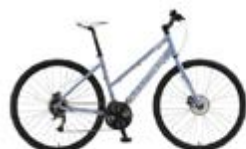
Hardrox C1 Prisgunstig og allsidig hybrid-sykel med god sittestilling. Messepris: 5.990,-