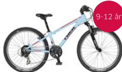
Trek Superfly 24 V-bremse Messepris: 3.999,-