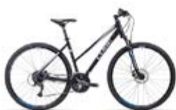
Cube Curve Pro Robust og pålitelig hybridsykel med dempegaffel og skivebremser. Messepris: 4.990,-