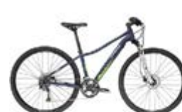
Trek 8.5 DS For eventyr både på landeveien og i terrenget. Messepris: 9.490,-