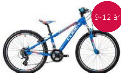
Cube Kid 240 Messepris: 3.999,-